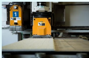
④サイディングカット・端材で出隅製作