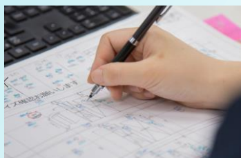
①採寸用の図面作成