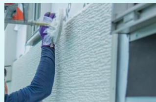
⑤現場配送・現場施工